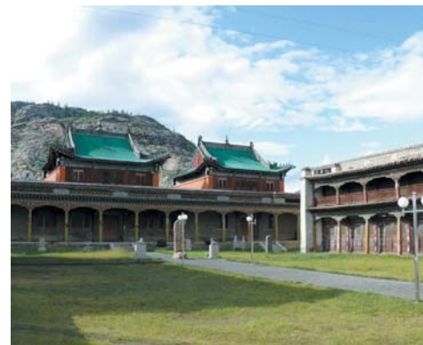
Monastère bouddhiste Zayain Khüree abritant le Musée d'Histoire et d'Ethnographie de Tsetserleg (Province de l'Arkhangai - Mongolie)