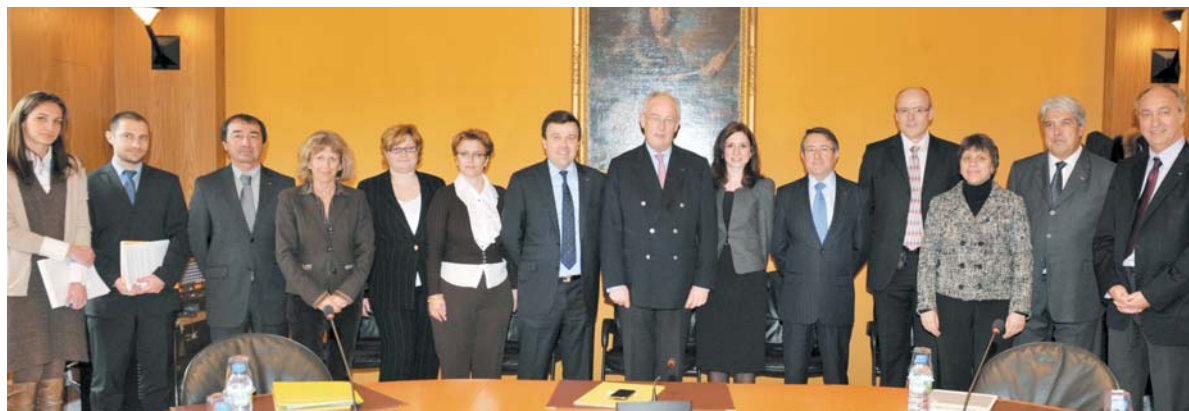
15 février 2011 - 1 ère réunion du Comité de pilotage de modernisation de l'État