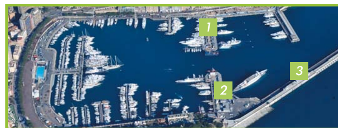
1/ Quai de l'Hirondelle • 2/ Quai Rainier 1 er - Grand Amiral de France • 3/ Quai Rainier III

Enfin, depuis un an, le Quai Rainier III (nouvelle digue) est en cours d'aménagement par le Service des Travaux Publics pour embellir l'ouvrage tout en créant une liaison par ascenseurs du parking et du quai vers la promenade supérieure. Cet aménagement concerne l'habillage des façades, l'aménagement intérieur de la zone VIP de la Gare maritime, l'intégralité de la petite gare maritime et le revêtement de sol des promenades. Ces travaux s'achèveront début mai 2011.