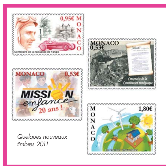
Quelques nouveaux timbres 2011

au départ de Monaco et qui changent toutes les semaines. Je m'occupe également de créer, de modifier ou de mettre en page nos supports de communication visuelle (journaux, presse spécialisée, vitrines dans Monaco...) ainsi que les illustrations des cartes de vœux, enveloppes, encarts philatéliques personnalisés, cachets souvenirs des expositions auxquelles l'Office des Émissions de Timbres-Poste participe. »